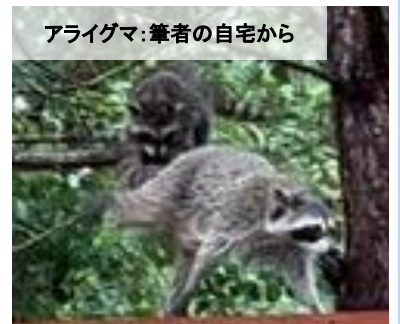
アライグマ:筆者の自宅から

※ヒューストンで生活する皆様の生活日記としてより幅広い対象からリレー式でご寄稿いただけるよう、今月号より「ヒューストン日記」とシリーズ名を改めさせて頂きました。(編集部)