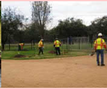
枯山水周辺の植栽