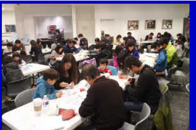
課題に真剣に取り組む参加者の皆さん