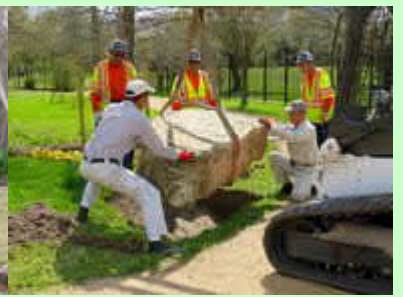
最後に1.6tの大きな岩を流れの手前に据えた