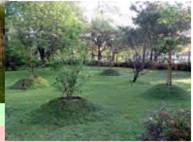
桜は、全て支柱とセンターポールを立てた

尤も、冠木門周辺にはさらに白い御影石の縁石が据えられることになっており、大きな門の足もとには大きなフラットな石も敷かれる予定です。門の外側には左右に分けて黒松と御影石の記念碑が配置されるプランで、『日本庭園』の揮毫をお願いする仕事はまだ残っています。