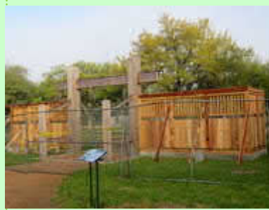
板塀部分の組み立てが進んだ

他方、冠木門(カブキモン)の作業は、市が行った鉄のフェンスの位置との調整に時間がかかりましたが、板塀のコンクリート土台作りが済むと、かねて制作済みであった板塀部分の組み立てが進みました。非常に残念ながら京都のメーカーに注文した扉の金具類(特大の蝶番など)の一部が空輸途中で紛失し、シカゴの税関や地元のPostal Serviceの倉庫まで徹底的に調査しましたが発見できず、再注文のやむなきこととなりました。4月上旬頃に到着予定となっていますので、受け取り次第、扉取り付け作業を急ぎ、5月2日に予定される記念式典に間に合わせたいと願っています。