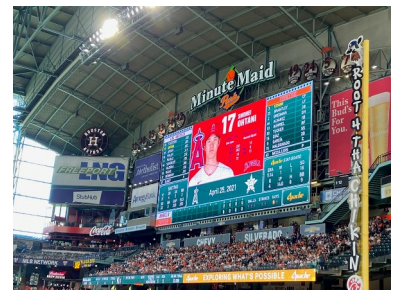
写真3 大谷翔平選手がMinute Maid Parkに登場