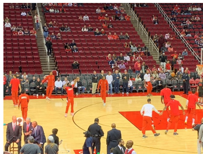
写真1 Toyota CenterでのRocketsの試合前練習風景

最良のチームができれば早速試合を見ましょう。アウェーの試合だとTV中継で楽しむことにはなりますが、ホームゲームならば是非ともスタジアムで生観戦したいところです。家でTVを見る方が楽だという方もいらっしゃるかもしれませんが、スタジアムでの観戦にはTV中継にはない魅力がたくさんあります。生の迫力や感動に加え、試合の途中途中でのTシャツ