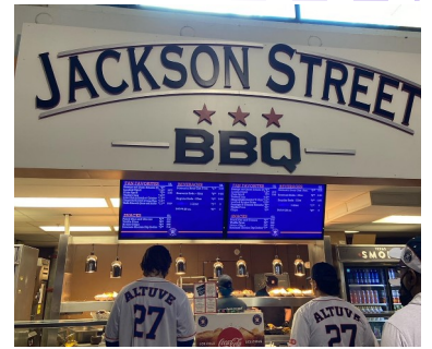
写真2 Minute Maid Park内の売店

地元のチームを応援する以外にもLos Angeles Angelsの大谷翔平選手(写真3)を応援するなど、アウェーのチームを目標に観戦する楽しみもあります。また通常の試合観戦とは別に、 バックヤードツアー なども行われています。