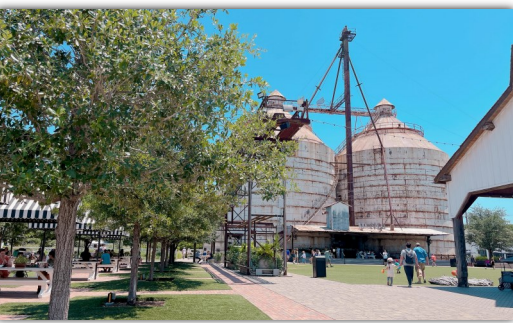
▲Magnolia Market at the Silos 2棟のサイロを中心に店舗が立ち並ぶ敷地内

そんなチップ&ジョアナ夫妻が、1950年代に閉鎖されたWacoの綿花製油会社の跡地を買い取り、家具やインテリア雑貨、ガーデニンググッズ、アパレルショップ、ベーカリーなどを抱える複合ショッピングモール Magnolia Market at the Silos に変貌させました。敷地内にはフードトラックパークや広々としたピクニックエリアなどもあり、かつて倉庫として使われていた2棟のサイロが季節ごとに美しい装飾で彩られ、その名の通り見事な象徴として生かされています。2016年にこの Magnolia Market at the Silos が開業したことで、それまで知られていなかった田舎町Wacoの知名度は一気に高まり、全米中から多くの観光客が訪れ、今や Fixer Upper ならびに雑誌 MAGNOLIA ファンの聖地とも言われるほどの人気観光地となりました。