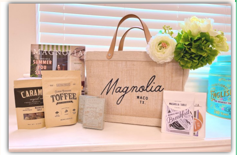
▲Magnolia Marketで購入した物の一部

があります。 Magnolia Market で購入できる食器やカトラリー類を用い、デザインにこだわり抜いた空間で、アメリカ式ブレイクファストをいただけるレストランです。個人的な所感ですが、価格設定も決して高くなく、見栄えだけに凝ったものでもなく、素材を生かした料理はどれも大変美味でした。食後に提供されたオリジナルキャラメルは、日本の某有名生キャラメルかと思うほどの美味しさ！レストラン横にはカフェとギフトショップを兼ねた店舗があり、そちらで購入することも可能です。