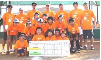
男子C - Jr チーム