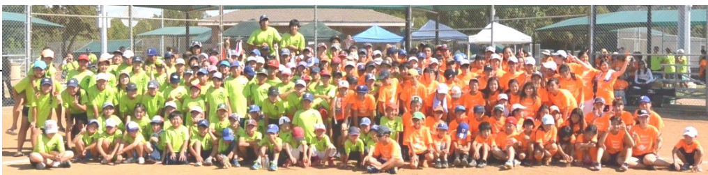
ヒューストンVSダラス 小中高生 親善ソフトボール大会 観戦記