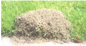
比較的分かりやすい巣

予防法としては巣に近寄らないことが一番ですが、誤って巣を踏んだり触ったりする状況も多くみられます。なるべくつま先を保護するような靴を履いたり、特に庭仕事をするときなどは手袋や靴下を履いたりすることで、万が一が攻撃しようとしても、噛まれたり刺されたりする前に払いのけることができます。市販のファイアーアント駆除薬を使って巣を全滅することは可能ですが、数週間かかることもあります。衛生害虫として、なかなか手強い相手ですね。