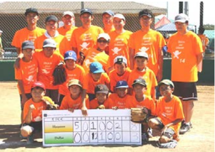
男子C - C チーム