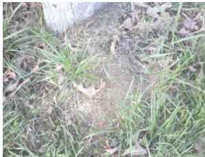
非常に見つけにくい巣