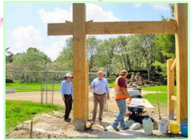
門柱だけ立ち上がった冠木門

の冠木門と枯山水庭園はいずれも未完了です。冠木門の門だけは立ち上がっていますが、その下に続く歩道は未完了です。