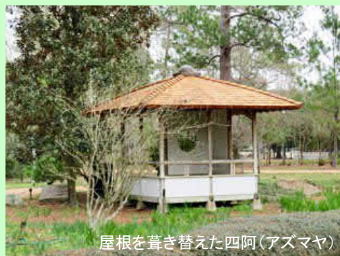
屋根を葺き替えた四阿(アズマヤ)

2016年初めから始まった本格的作業は、3月末頃にはほぼ完了しましたが、日本庭園内