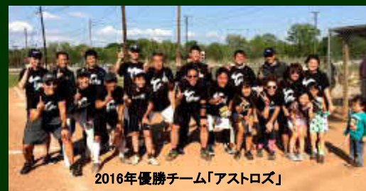
2016年優勝チーム「アストロズ」

参加全22チームは様々な思いで大会に臨んでいます。勝利を目指し、今年も熱戦が期待されます。選手の皆さんの健闘を祈ります。