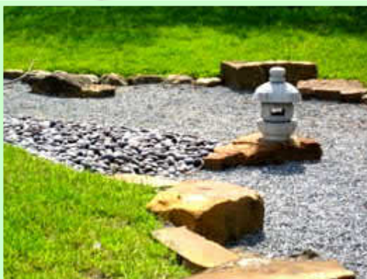
寄付いただいた石灯籠の置かれた枯山水