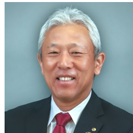
泥 克信 Kaneka America Holdings, Inc.