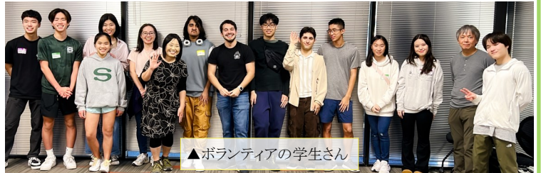
▲ボランティアの学生さん