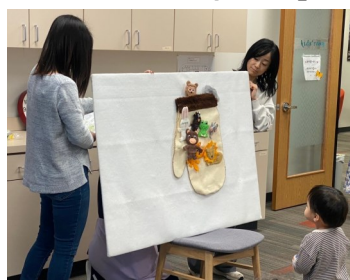
▼パネルシアター『てぶくろ』

読み物のコーナーでは、パネルシアター『てぶくろ』を紹介しました。折しも数日前にヒューストンで大雪が降り、手袋を使っていた子どもたちも多かったため、大きな手袋が登場すると大喜び！キツネやウサギなど、さまざまな動物たちが次々に手袋の中に入っていくお話に、子どもたちはワクワクしながら見入っていました。