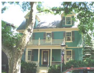
ブルックライン (JFK生家)