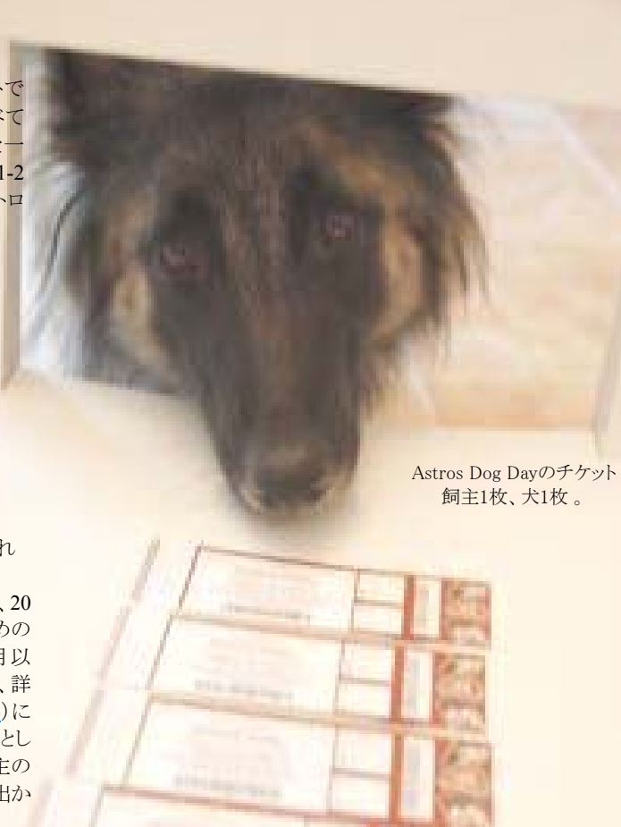
Astros Dog Dayのチケット 飼主1枚、犬1枚。

ビールやポップコーンを片手に、相棒の犬を傍らに、野球観戦ができるという Dog Day。野球好き、犬好きな方は、お気に入りの野球チームの Dog Day をぜひお調べになって、お出かけ頂きたいと思います。アメリカならではの野球観戦ができることをお約束致します！