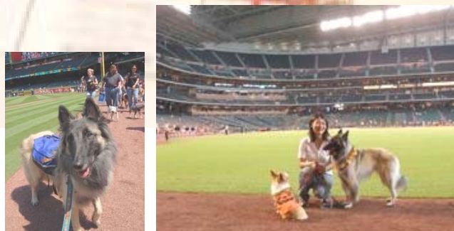
Pooch Parade。犬と一緒にグラウンドを1周！