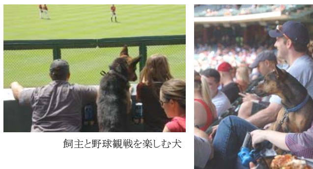
飼主と野球観戦を楽しむ犬