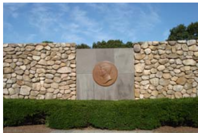
ハイアニス (JFK記念碑)

そしてマサチューセッツ州の南東ケープ・コッドの南海岸、閑静な高級リゾート地ハイアニスには、代々ケネディ家の別荘がある地。大統領になってからもその激務の合間にここで疲れを癒し、ときに重大な決定に臨んでいたとのことだ。この町の中心部に、とても小さなJFK Hyannis Museumがあり、別荘で沈黙考するJFKの写真など、ケネディ家の違った一面を見ることが出来る。2009年夏、JFKの末弟で半世紀にわたり国会議員を務めたテッド・ケネディが亡くなった時も、ハイアニスの住人は彼の死に心から哀悼の意を表したという。政治だけでなく、数々のゴシップで常に注目されるケネディ家にとって、この地は心からくつろぐことのできる故郷であつたに違いない。余談だが、この町にはスーパーでよく見かけるCape Cod Potato Chipsの工場があり見学もできる(JFKも食べたのだろうか?)また、オバマ大統領ら歴代の大統領や著名人が夏休みを過ごすマーサズ・ビンヤードという島も、ハイアニスからフェリーで1時間のところにある。この辺りは昔も今も大統領と縁があるようだ。