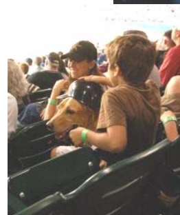
食べ終わったポップコーンの容器はヘルメットに