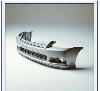
▲欧州ではPPリサイクル樹脂は自動車バンパー部品等への活用が検討されている。

欧州では、厳格な法規制がリサイクル率向上の鍵となっています。欧州と米国の主な違いは、政策の統一性と規制の厳格さにあります。欧州は全体的にリサイクルプラスチックの利用促進に向けて統一的で厳格な規制を実施し、企業や市民に対して明確な目標を掲げています。例えば、欧州の自動車産業でもリサイクルプラスチックの利用が進んでおり、2030年までに自動車部品におけるリサイクルプラスチック比率を25%以上にする目標が掲げられています。リサイクルPP（ポリプロピレン）は車両内装やバンパーに活用され、軽量化と環境負荷の低減に貢献することが期待されています。一方、米国は州ごとに異なるアプローチを採っており、リサイクル率やプラスチック廃棄物削減の進捗にばらつきがあります。米国でも企業へのインセンティブや一部の州でのプラスチックリサイクル促進の取り組みが進んでおり、改善が見られています。欧州はリサイクルプラスチックの普及に関して先進的なモデルを提供しており、米国は地域ごとの取り組みが進行中であるものの、より一貫した全国規模での政策が求められています。