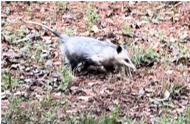
▲三水会館から車で10分ほどの公園で見たオポッサム

犬がいる庭は危ないとウサギが思って、我が家には来なくなるのではないかと思っていたのですが、その期待を裏切るようにウサギは毎日のように現れ、そしてある日、ついに私が避けたかった事態が起きてしまいました。ウサギがいないことを確認してアクアを