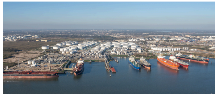
▲ヒューストン近郊のLPG輸出ターミナル