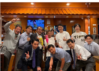
阪神愛等を語り合う懇親会