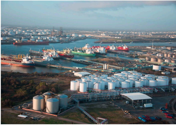
▲ヒューストン近郊のLPG輸出ターミナル

日本のエネルギー供給を考えると、原油やLNG（液化天然ガス）は、輸送・製造・発電といった幅広い分野において、日本経済を支える基幹エネルギーとして重要な役割を果たしてきました。同時に、私たちの日々の暮らしに身近な形で寄り添い、家庭や地域社会の日常を足元から支えてきたエネルギーとして、LPG（LPガス：液化石油ガス）も欠かすことのできない存在です。全国各地の住宅や地域社会に広く行き渡り、調理や給湯、暖房など、毎日の生活に密着した用途で使われてきたLPG。そして現在、このLPGを安定的に日本へ届けている最大の供給地が、米国テキサス州なのです。