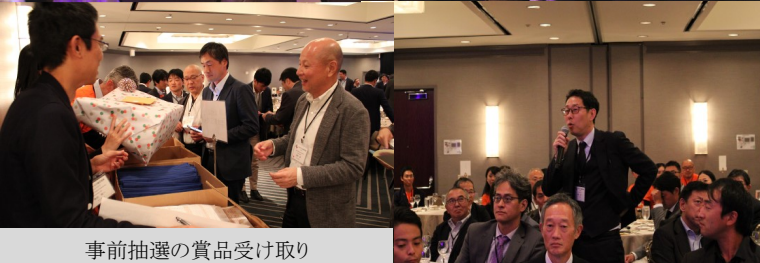
事前抽選の賞品受け取り