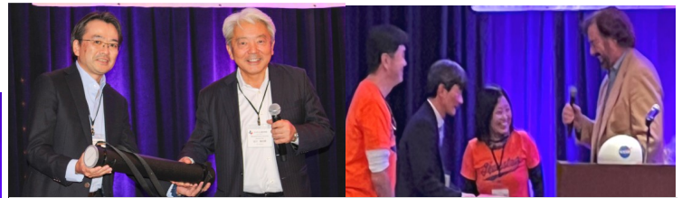
五十嵐ダラス商工会長(左)と石川会長(右)