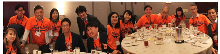
運営スタッフ (米国三菱重工、北米三菱商事、近鉄インターナショナル)