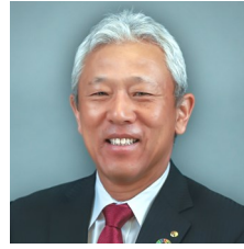
泥 克信 Kaneka America Holdings, Inc.